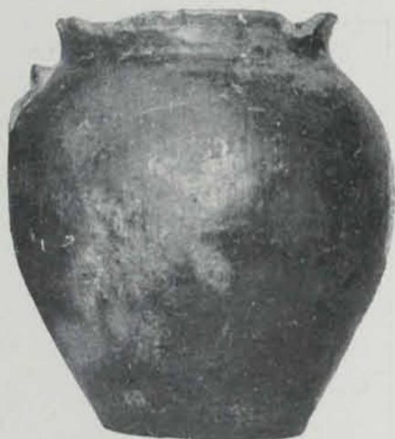
(Museu de Barcelona)