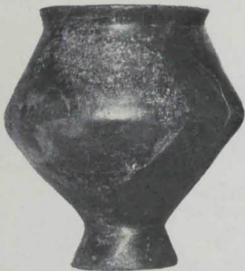
(Museu de Barcelona)

SEGONA SERIE. — La seva ceràmica procedeix també de necròpolis d'incineració (1). La disposició dels sepulcres es menys coneguda. D'Anglès no sabem altres objectes que les urnes (figs. 34, 35 i 36); en canvi, al Pla de Gibrella, a Capsech (2), amb la ceràmica apareix un punyal