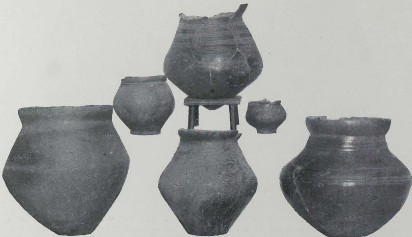
Fig. 29. — Vasos de la necròpolis de Terrassa

tics enterraments, pel fet d'haver estat dipositats en llcs fondos que han anat cimplint les sorres de montanyes granítiques properes.