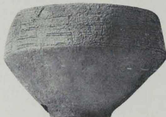
Fig. 33. — Vas de Vilars (Botet)

A Terrassa (fig. 29) i a Sabadell (4) es troben vasos de forma més o menys ovoidia i amb una vora sortint cap enfora, semblants als tipus italians de la cultura de Vilanova. En aquests vasos s'hi troben incisions de meandres.