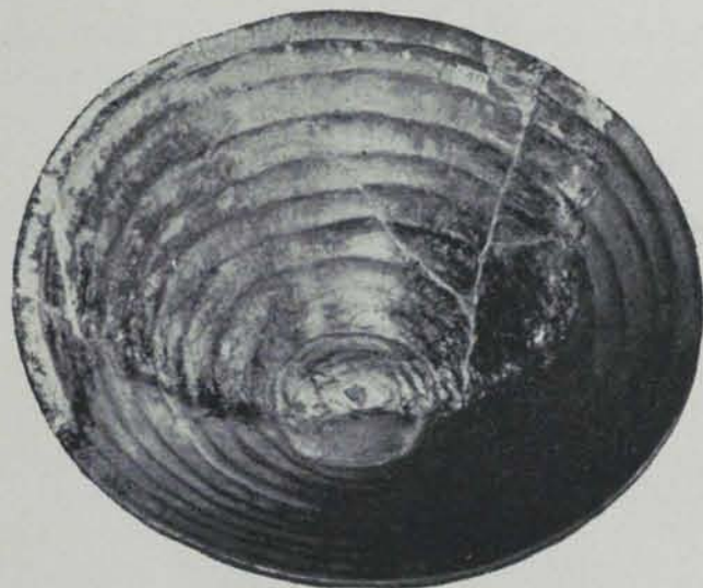
Fig. 31. — Plat de la Punta del Pi

PRIMERA SERIE. — Els vasos són fets a mà, de fang de color negrós, ben polit generalment, adornats amb acanalats en els colls i amb incisions de solcs amples, generalment meandres i segments de circumferència. Es troben generalment sols, sense altres objectes: únicament a la necròpolis d'Espolla hi aparegueren, a més, un clau i restes de cadena de bronze i una mena de flauta de fang. Els que serveixen d'urna solen estar tapats per plats o bé per trossos de llosa circulars i dipositats senzillament en un clot. Sols a Vilars i a la Punta del Pi es trobaren sepulcres tancats per un cercle de pedres.