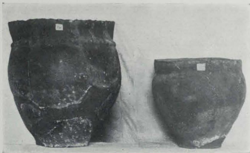
Fig. 30. — Vasos de la Punta del Pi

La segona serie està constituïda per les necròpolis d'Anglès (6), del Pla de Gibrella, a Capsech, prop d'Olot (7) i de Perelada (8), totes a Girona, i pertany a fins de l'època de Hallstatt.