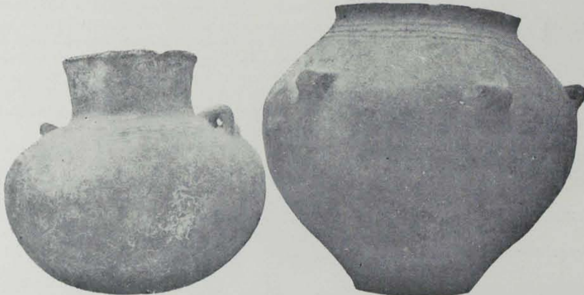
Fig. 34. — Vasos d'Anglès (Museu de Girona. — Botet)

A Terrassa (fig. 29) i a Sabadell (4) es troben vasos de forma més o menys ovoidia i amb una vora sortint cap enfora, semblants als tipus italians de la cultura de Vilanova. En aquests vasos s'hi troben incisions de meandres.